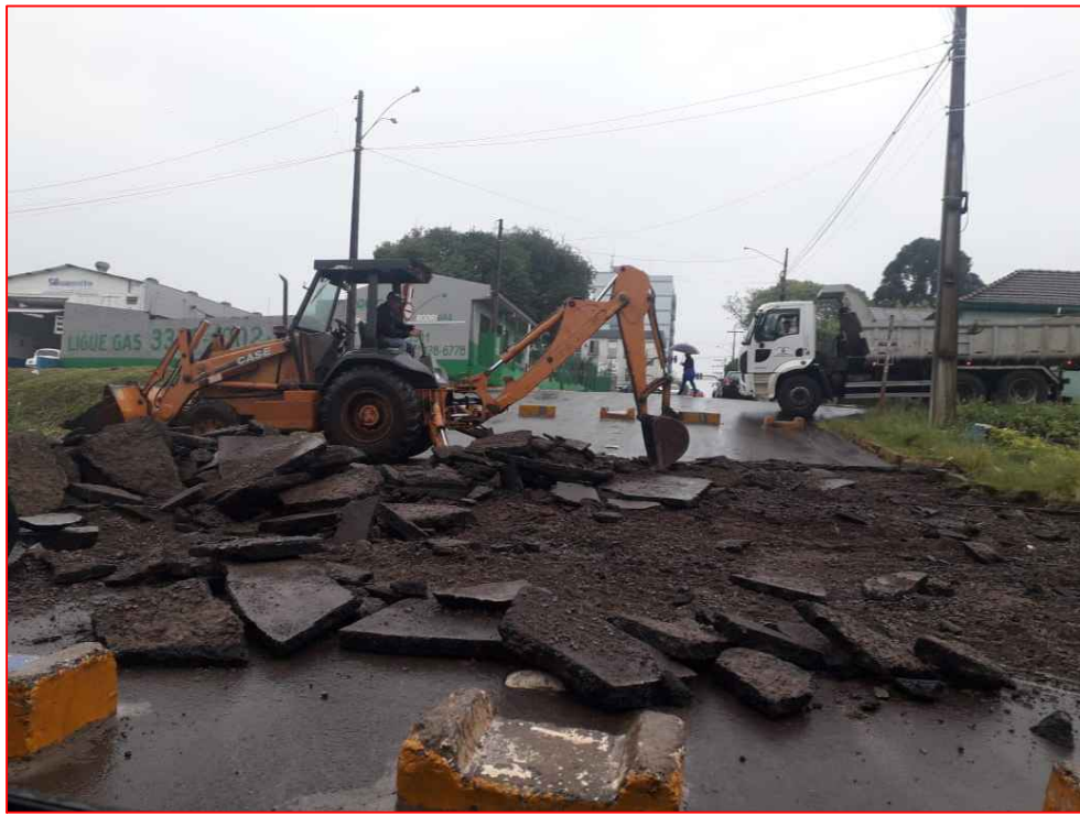
Demolição de Pavimentação Asfáltica